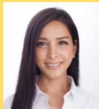
サヘル・ローズ氏 (女優/タレント/イラン出身)