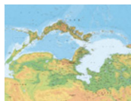
環日本海諸国図(逆さ地図)

業務時間/月～金 8:30～17:15(土、日、祝祭日、年末年始は休業) 〒930-8501 富山市新総曲輪1-7 富山県観光振興室内 TEL 076-444-3339/FAX 076-444-4404 E-mail adm@nihonkaigaku.org URL http://www.nihonkaigaku.org/