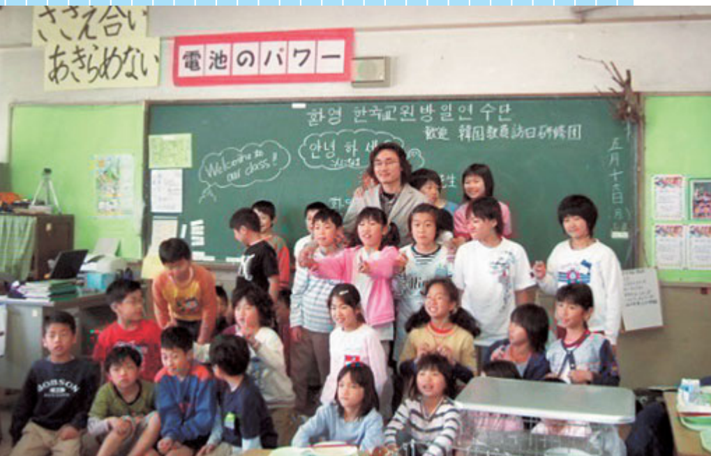
韓国の教員と記念写真！ - 富山市立堀川小学校

(財)とやま国際センター 〒930-0856 富山市牛島新町5-5 インテックビル4F(タワー111) TEL(076)444-2500 FAX(076)444-2600 E-mail:tic@tic-toyama.or.jp URL:http://www.tic-toyama.or.jp