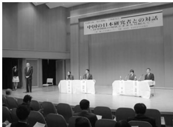
開会の挨拶をする石井知事

遼寧省と友好県省の関係にあり、長年にわたり中国との友好関係を築いてきた富山県。昨年10月からの「富山ー上海便」就航により、より活発な今後の交流が期待されます。