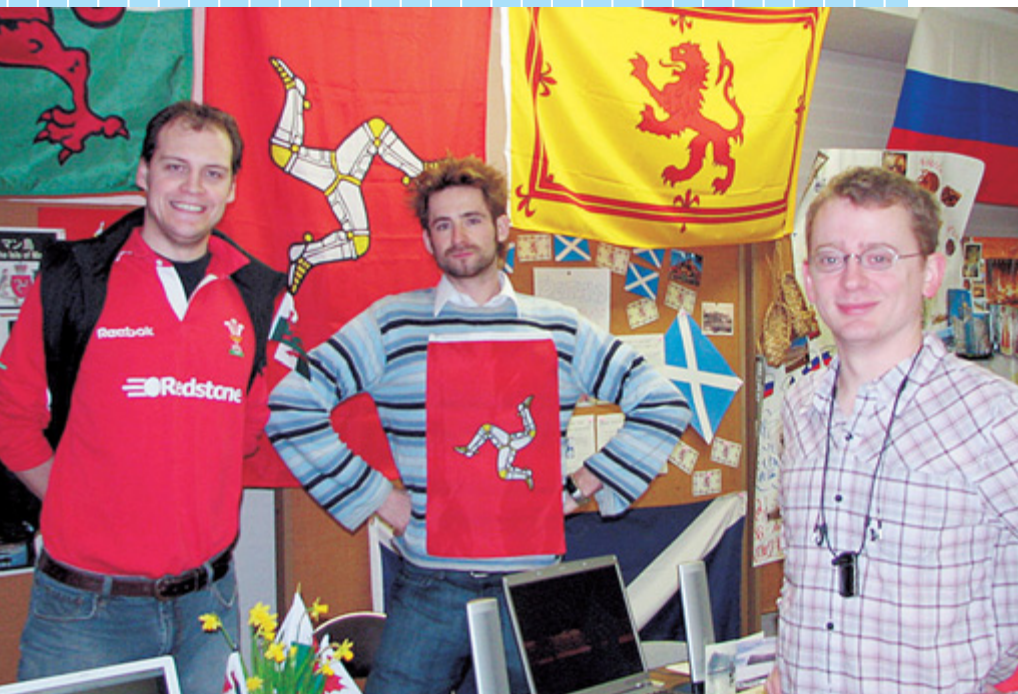
外国語指導助手(ALT)の皆さん 出身国紹介ブースで