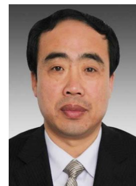
郝 建軍 市長