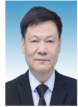
宋 誠 書記 李 文飆 市長