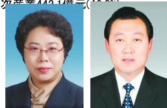
張 淑萍 書記 謝 衛東 市長