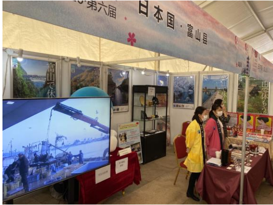
(富山県ブースの様子 1)