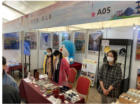
(富山県ブースの様子 2)