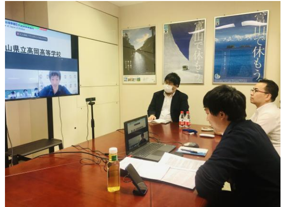
(富山県大連事務所会議室の様子)