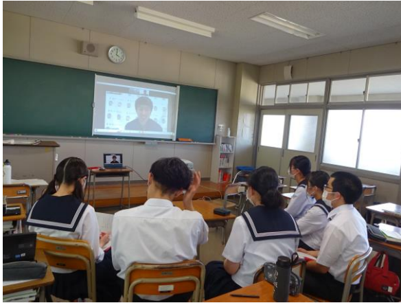
(高岡高校の生徒の皆さんの様子)

県大連事務所と高岡高校を Zoom で連結し、海外で活躍する現役の外交官にご講演頂きました。