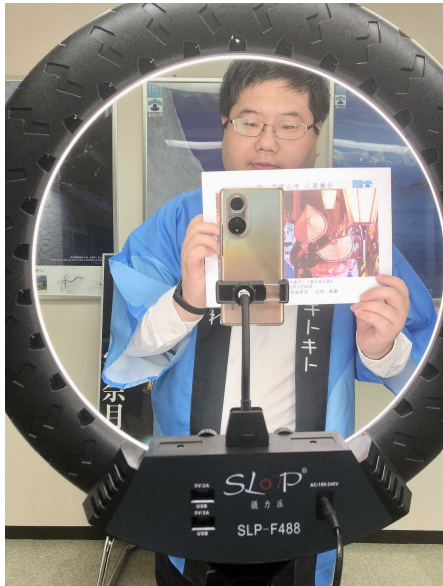
大連事務所による八尾紹介