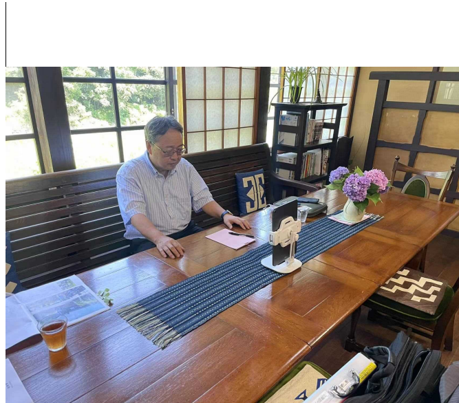
日本の桂樹舎本社での撮影の様子