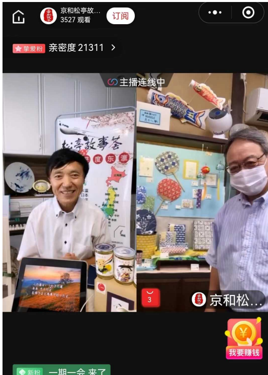
ショールームからの商品紹介