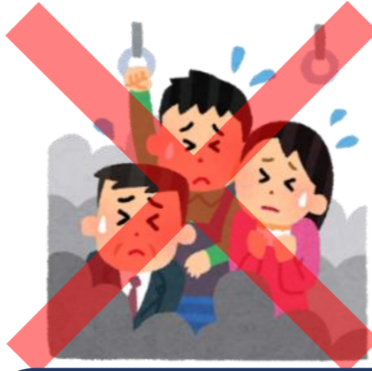
రద్దీకి దూరంగా ఉండడం