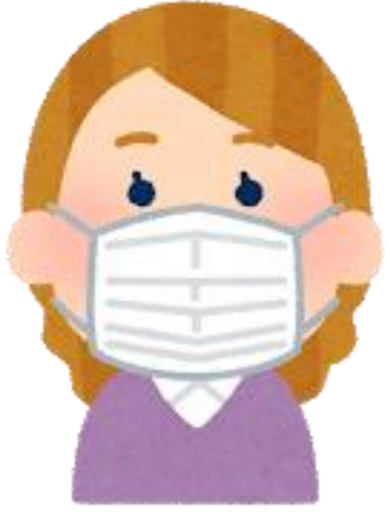
ఖచ్చితంగా మాస్క్ ధరించడం