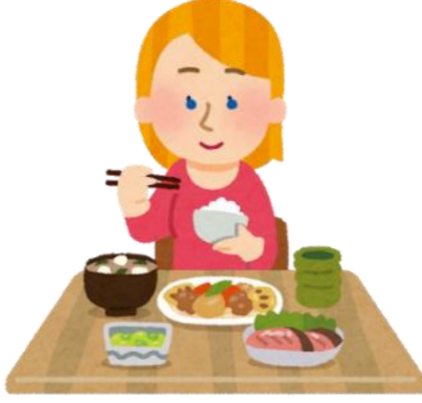
సమతుల్య ఆహారం తినడం