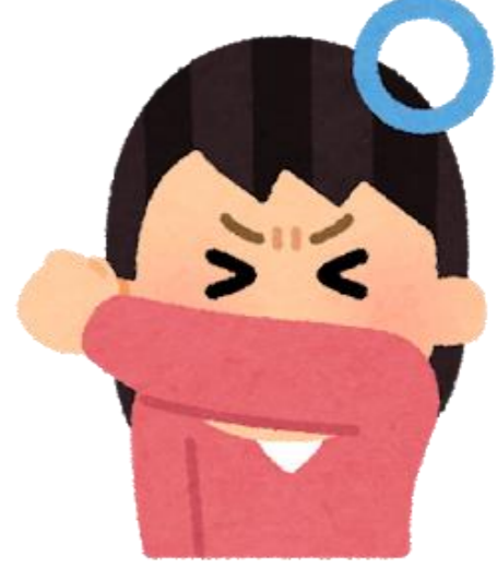
దగ్గుకు చేతులు అడ్డం పెట్టడం

జ్వరం జలుబు వంటి లక్షణం ఉన్నవారికి (మెడికల్ చెక్ అప్ లేదా సంప్రదించ దానికి ముందు గుర్తు పెట్టుకోవాల్సిన విషయాలు)