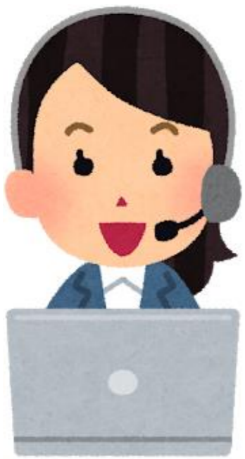
(రిటర్ని మరియు హై రిస్క్ కాంటాక్ట్ కన్సల్టేషన్ సెంటర్)

✳️మీకు ఇప్పటికే ఏదైనా అనారోగ్యం ఉంటే మరియు దాని లక్షణాలు మారినట్లయితే, లేదా కొత్త కరోనావైరస్ సంక్రమణ కాకుండా వేరే ఏదైనా అనారోగ్యం గురించి మీరు ఆందోళన చెందుతుంటే, మొదట, దయచేసి మీ కుటుంబ వైద్యుడిని టెలిఫోన్ ద్వారా సంప్రదించండి.