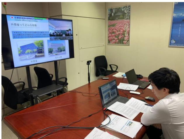
(富山県大連事務所会議室の様子)